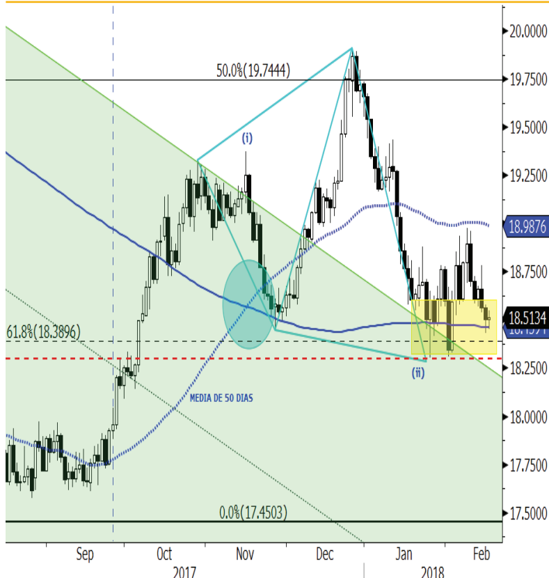
MXN Curncy (Mexican Peso Spot) KALEIDOSCOPIO Monex Daily 16AUG2017-16FEB2018 16-Feb-2018 15:35:16

El día de hoy, el TC registró un cierre prácticamente sin cambios y volvió a colocarse sobre su media de 200 días (18.46 pesos), finalizando por arriba de dicho promedio y concluyendo la semana por arriba del nivel psicológico de 18.50 pesos.